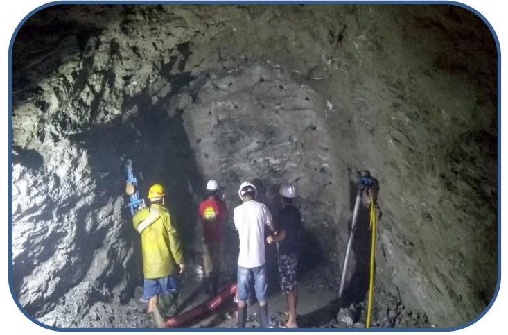
आयोजनाका प्राविधिकबाट सुरङको निरिक्षण गरिदै ।

त्यसैगरी, Penstock Pipe को निर्माण कार्य पनि तीव्र गतिमा भइरहेको छ । बटवलस्थित मेगा हाइड्रो एण्ड इन्जीनियरिङको फ्याक्ट्रीमा Penstock को ४०० मिटर पाइप रोलीड भइसकेको छ भने तिन वटा बेन्ड Assembly भई र १५० मिटर Penstock Pipe आयोजना स्थलमा पुगिसकेको छ । हाल पेनस्टक पाइपको Bifurcation र Gate Leaf को निर्माण कार्य सकिएको छ र आयोजना क्षेत्रमा ढुवानी क्रममा रहेको छ ।