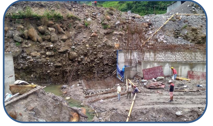
इन्टेक गेट बेसको डन्डि बाँधने कार्य गरिँदै ।

विद्युतगृहको दुवै Unit को Tailrace Gate Frame को जडान कार्य पनि सकी विद्युतगृहको Raft floor Foundation को निर्माण कार्य सकिएको छ । विद्युतगृहको Beam र Pillar निर्माण कार्य पनि अघि बढिसकेको छ । निकट भविष्यमा नै विद्युत गृहमा EOT Crane जडान गर्ने लक्ष्य कम्पनीको रहेको छ ।