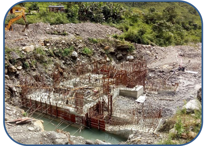
आयोजनाको विद्युतगृहको निर्माण कार्यको एक भलक ।