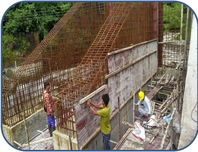
आयोजनाको अन्डरश्लुइसको निर्माण अघि बढाईँदै ।

दोर्दी-१ जलविद्युत आयोजनाको विद्युत राष्ट्रिय प्रसारण ग्रीडमा जोड्न आवश्यक नेपाल विद्युत प्राधिकरण अन्तर्गतको किर्तिपुर सबस्टेसनको निर्माण कार्य पनि तीव्र गतिमा अघि बढिरहेको छ । यसका साथै टावरहरुको निर्माणका लागि फाउन्डेसन निर्माण कार्य पनि नेपाल विद्युत प्राधिकरणले अघि बढाएको छ ।