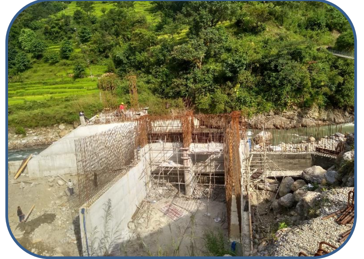
आयोजनाको इन्टेक तथा बाँध क्षेत्रको एक झलक ।