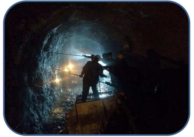
सुरुङ्गमा रक बोल्टको लागि ड्रिलिङको काम गरिदै ।

यस आयोजनाको विद्युतगृह र Penstock Line Civil Work को भौतिक निर्माण कार्य पनि २८.५७% पुगेको छ । त्यसैगरी, Penstock Pipe को निर्माण कार्य पनि तीव्र गतिमा भइरहेको छ । बुटवलस्थित मेगा हाइड्रो एण्ड इन्जीनियरिङको फ्याक्ट्रीमा Penstock को ४०० मिटर पाइप रोलीड भइसकेको छ भने तिन वटा वेन्ड Assembly भई र १५० मिटर Penstock Pipe आयोजना स्थलमा पुगिसकेको छ । हाल पेनस्टक पाइपको Bifurcation र Gate Leaf को निर्माण कार्य सकिएको छ र आयोजना क्षेत्रमा ढुवानी कममा रहेको छ ।