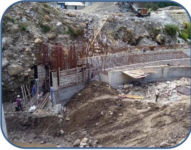
आयोजनाको इन्टेकको निर्माण अघि बढाईदै ।

दोर्दी-१ जलविद्युत आयोजनाको विद्युत राष्ट्रिय प्रसारण ग्रीडमा जोड्न आवश्यक नेपाल विद्युत प्राधिकरण अन्तर्गतको किर्तिपुर सबस्टेसनको निर्माण कार्य पनि तीब्र गतिमा अघि बढिरहेको छ । यसका साथै प्रसारण लाइनका टावरहरुको निर्माणका लागि फाउन्डेसन निर्माण कार्य पनि नेपाल विद्युत प्राधिकरणले अघि बढाएको छ ।