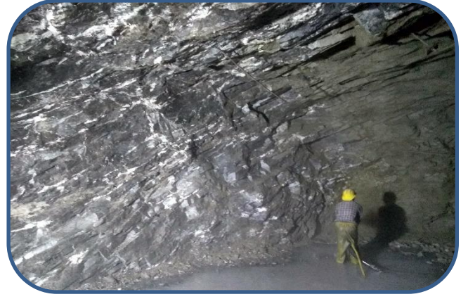
सुरुङ्गमा सटकिटको कार्य गरिँदै ।

आयोजनाको EOT निर्माण कार्य सकिई हाल उक्त समाग्री हुवानीको कममा वीरगंज भन्सार आइपुगेको छ । कार्तिक महिनाको मसान्त भित्र उक्त केन आयोजनाक्षेत्रमा पुगिसक्नेछ । हाल विद्युतगृहको Beam र Pillar निर्माण कार्य अघि बढिरहेको छ । निकट भविष्यमा नै विद्युत गृहमा EOT Crane जडान गर्ने लक्ष्य कम्पनीको रहेको छ ।