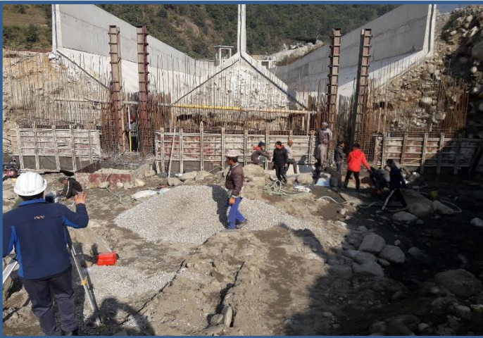
डिस्थाण्डरको Outlet gate तर्फको कार्य प्रगति ।

२५०० मिटर हेड रेस सुरुङ्ग रहेको यस आयोजनाको सुरुङ्ग २२९० मिटर उत्खनन् कार्य भइसकेको छ र आगामी दुई महिना भित्र सुरुङ्ग को Excavation को सम्पूर्ण कार्य सम्पन्न गरी सक्ने कार्य योजनाका साथ निरन्तर कार्य भइरहेको छ । त्यसैगरी आयोजनाको ३५ मिटर Underground Surge Tank को निर्माण कार्य को ६ मिटर Excavation कार्य सम्पन्न भइसकेको छ ।