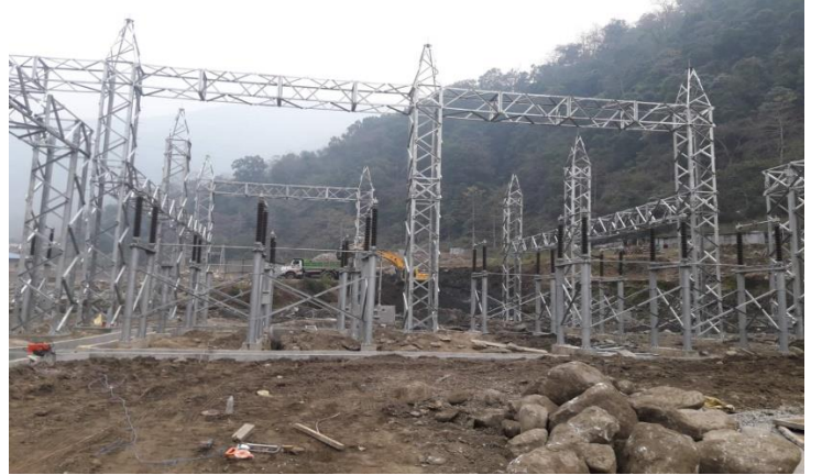
किर्तिपुर सबस्टेसनको निर्माणधिन कार्य प्रगति ।

दोर्दी-१ जलविद्युत आयोजनाको विद्युत राष्ट्रिय प्रसारण ग्रीडमा जोड्न आवश्यक नेपाल विद्युत प्राधिकरण अन्तर्गतको किर्तिपुर सब स्टेसनको निर्माण कार्य पनि तीब्र गतिमा अघि बढिरहेको छ । यसका साथै प्रसारण लाइनका टावरहरुको निर्माणका लागि फाउन्डेसन निर्माण कार्य पनि नेपाल विद्युत प्राधिकरणले अघि बढाएको छ ।