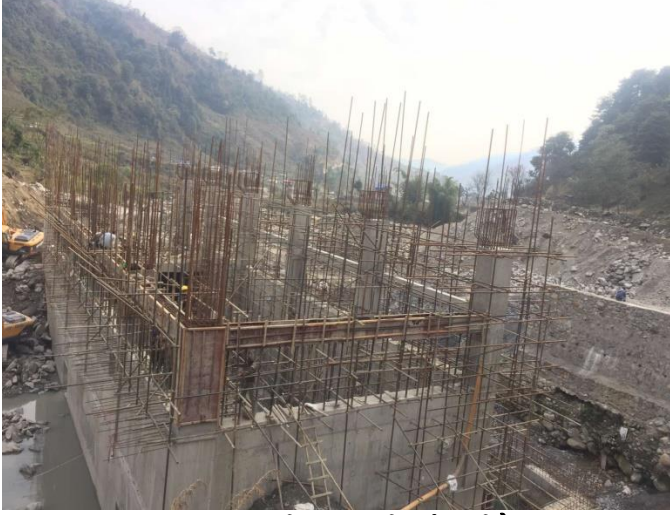
आयोजनाको विद्युत गृह निर्माण गरिदै ।

विद्युत गृहको भौतिक संरचना निर्माण कार्य पनि तिब्र गतिमा भइरहेको छ । आयोजनाको Turbine/Transformer/Generator को निर्माण कार्य सम्पन्न भई आयोजना पक्ष उक्त सामाग्रीको निरक्षणको कार्य भइ आयोजना स्थलमा ल्याउने तयारी भइरहेको छ । त्यसैगरी Switchyard को Electrical उपकरणहरु आयोजना स्थलमा ल्याउने काम निरन्तर भइरहेको छ । यस आयोजनाको विद्युत गृहको प्रगति विवरणको मुल्याङ्कनको आधारमा ६५ प्रतिशत कार्य सम्पन्न भइसकेको छ ।