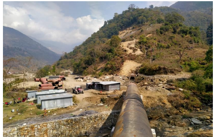
आयोजनाको पेनस्टकको जडान गर्ने कार्य गरिँदै ।

Hydro Mechanical कार्य अन्तर्गत रहेको Penstock को Civil कार्य अन्तर्गत Anchor Block को ढलान र Road crossing कार्य भइरहेको छ । आयोजना स्थलमा ७०० मिटर पेनस्टोक पाइप ढुवानी भई जस मध्ये ९६० मिटर पेन स्टोक पाइप जडान भइसकेको छ र Bifurcation Assembly का लागि Foundation Excavation को कार्य फागुनको पहिलो साता भित्र सम्पन्न गर्ने कार्य योजनाका साथ Excavation कार्य भइरहेको छ । Penstock Line Civil Work को भौतिक निर्माण कार्य ४५ प्रतिशत सम्पन्न भइसकेको छ ।