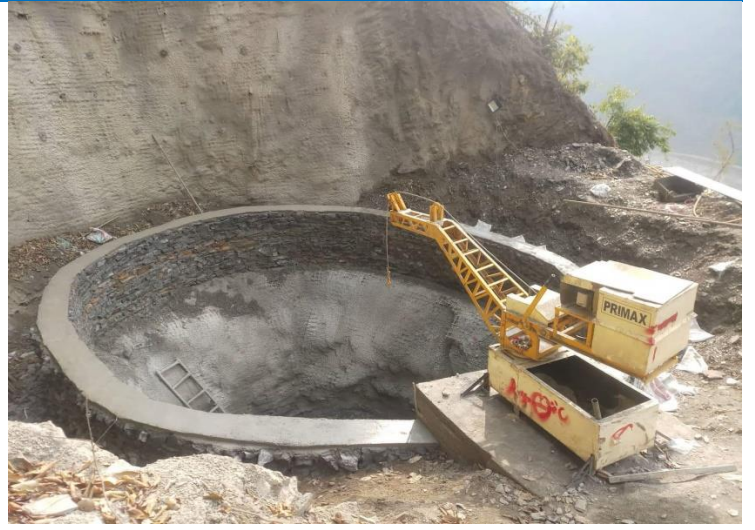
आयोजनाको सर्जटयाङ्क क्षेत्र ।

दोर्दी-१ जलविद्युत आयोजनाको नेपाल विद्युत प्राधिकरण अन्तर्गतको किर्तिपुर सब स्टेसनसम्म लैजाने प्रसारण लाइन निर्माणको प्रसारण लाइनको टावर निर्माण गर्न आवश्यक पर्ने जग्गाहरुको खरिद गर्ने प्रक्रिया अन्तिम चरणमा पुगेको छ । टावरको फाउन्डेसन निर्माणका लागि सिभिल कार्य शुरु भई ६ वटा Tower को Foundation Excavation को कार्य सम्पन्न भई सकेको छ । आयोजनाको Transmission line कार्य अन्तर्गत Tower, Conductor, Insulator, तथा अन्य आवश्यक सम्पुर्ण सामाग्रीहरु कार्य स्थलमा ल्याउने कार्य निरन्तर भइरहेको छ ।