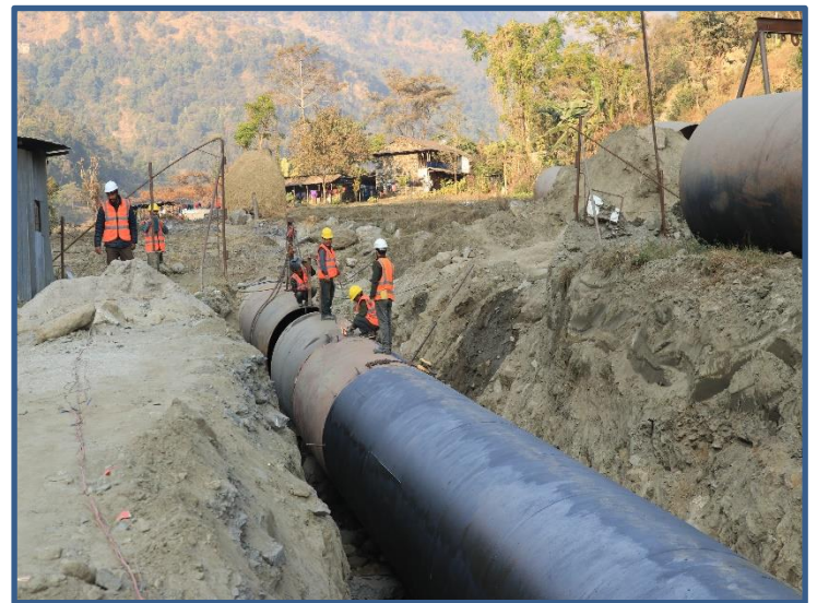
आयोजनाको Pen stock pipe को जडान गर्ने कार्य गरिदै ।

आयोजना स्थलमा ७२० मिटर पेनस्टक पाइप ढुवानी भई जस मध्ये ४३० मिटर पेन स्टक पाइप जडान भई ढलान भईसकेको छ र बाँकी पेन स्टक पाइप जडान निर्माण कार्य निरन्तर रुपमा अघि बढिरहेको छ ।