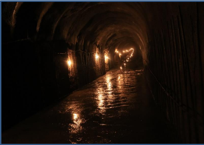
आयोजनाको सुरुङ निर्माण स्थलको कार्य फलक ।