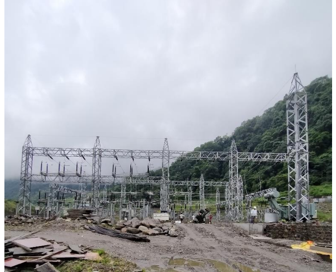
किर्तिपुर सब स्टेसनको निर्माणाधिन कार्य प्रगति ।

आयोजनाको पावर हाउस देखि ३.५ किलो मिटरमा रहेको NEA को Kirtipur Substation को निर्माण कार्य भइरहेको छ । जुन सबस्टेसनमा उत्पादित विद्युत, विद्युत प्रसारण लाईनको मध्यमबाट विद्युत प्रवह गरिने छ ।