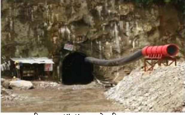
सुरुङ्ग भित्र ventilation राखे पछि