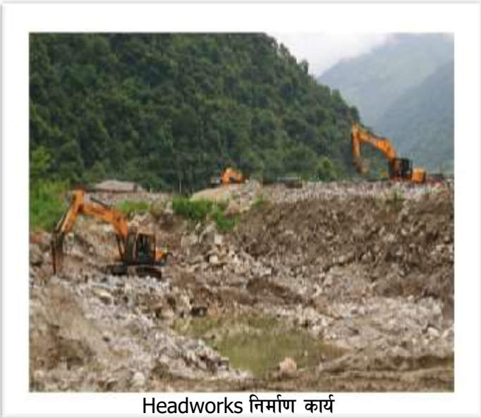
Headworks निर्माण कार्य

हेडवर्क्स क्षेत्रमा रहेको Desander Excavation कार्य जारी छ र हेडवर्क्सको सुरक्षाको लागि ग्यावियन पर्खाल निर्माण गर्ने कार्य पनि भइरहेको छ। त्यसैगरी यस क्षेत्रमा रहेका चट्टान फुटाउन विस्फोट कार्य पनि भइरहेको छ।