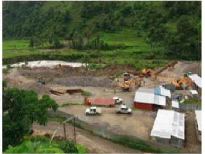
आयोजनाको Headworks क्षेत्र

यस आयोजना निर्माणका क्रममा दोर्दी गाउँपालिकाका स्थानीय प्रशासन र स्थानीय बासिन्दाहरुबाट पूर्ण साथ र सहयोग प्राप्त भइरहेको छ।