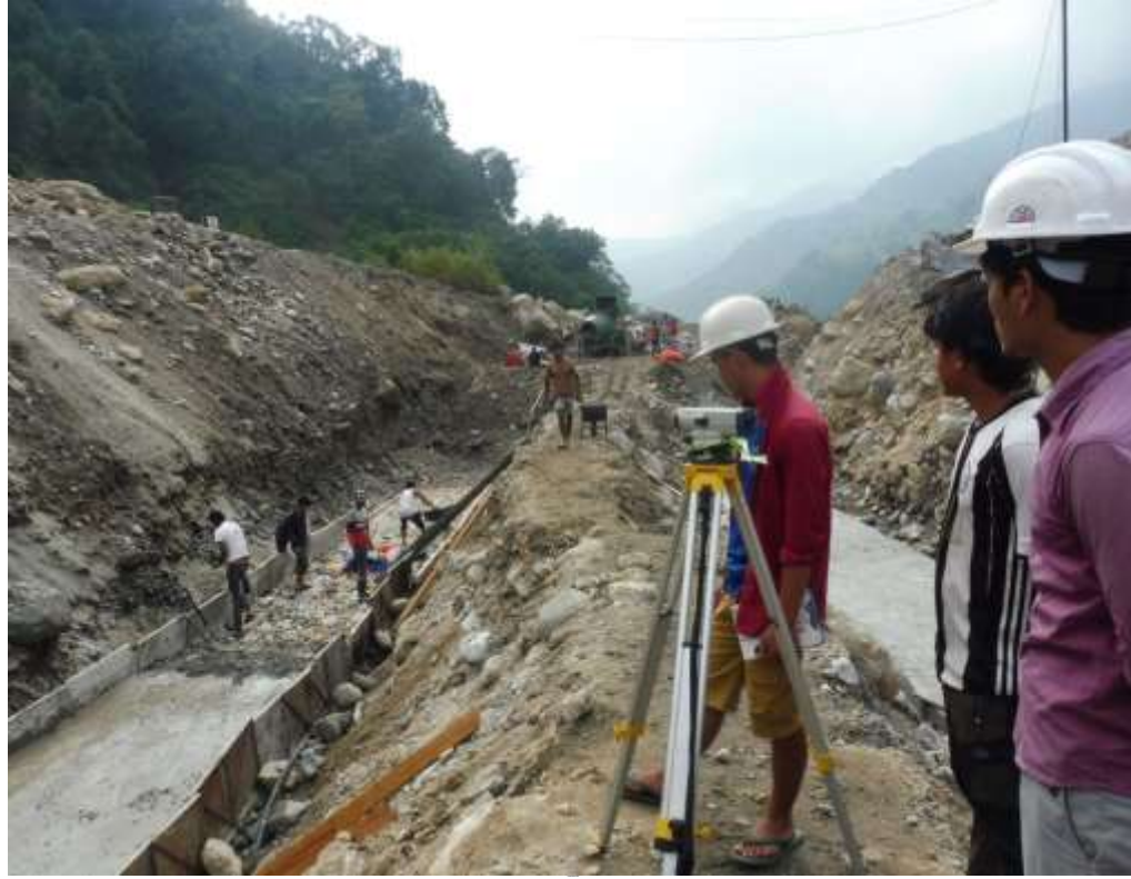
आयोजना निर्माण कार्य तीव्र गतिमा