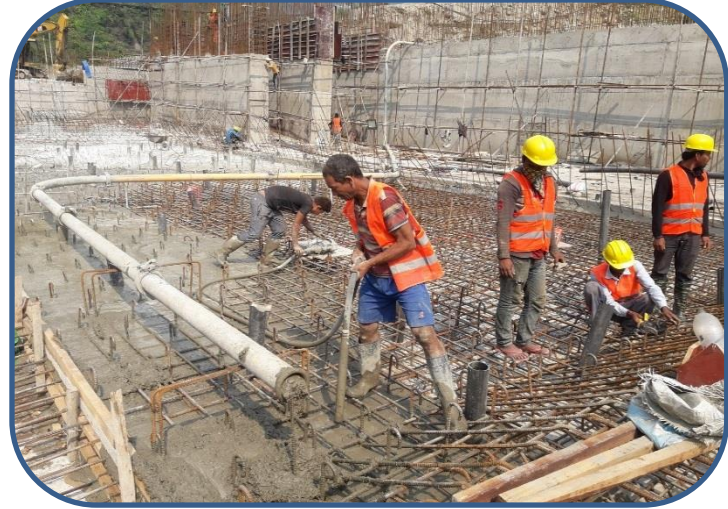
वाँध भन्दा तल्लो क्षेत्रमा Concreting कार्य गरिदै ।