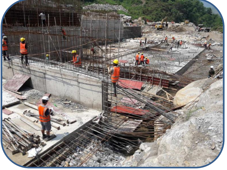
वाँध क्षेत्रमा भइरहेको निर्माण कार्य गरिदै ।

यस आयोजनाको Electromechanical कार्यका लागि B Fouress Pvt. Ltd. (BFL) सँग सम्झौता भइसकेको छ । हाल Earth Mat लमजुङ्गस्थित आयोजना स्थलमा पुगिसकेको छ । जेष्ठ पहिलो हप्तामा Earth Mat विछ्याइ विद्युतगृहको निर्माण कार्य तीव्र गतिमा अघि बढ्ने छ । यसका साथै विद्युतगृहको आवश्यक Design कार्य सम्पन्न भइसकेको छ र हाल Power house मा Excavation को काम अन्तिम चरणमा पुगेको छ । यसका साथ Power House Protection को लागी Wall निर्माणको कार्य पनि जारी छ ।