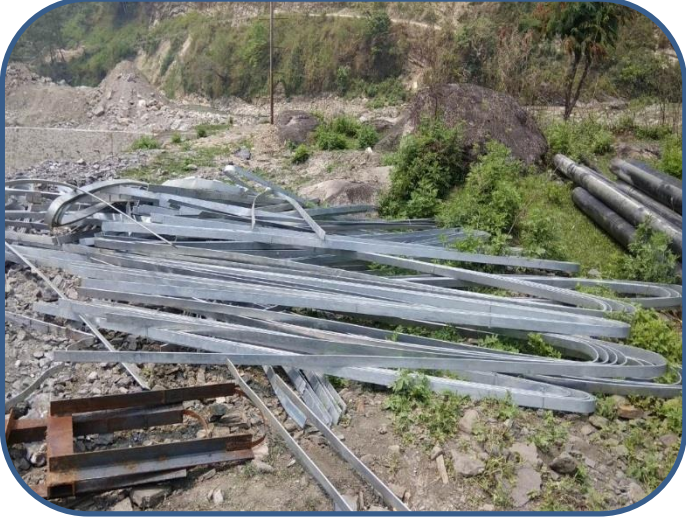
आयोजनाक्षेत्रमा भण्डारणा गरिएको विद्युतगृहमा विछ्याइने Earthmat

दोर्दी-१ जलविद्युत आयोजनाको विद्युत राष्ट्रिय प्रसारण ग्रीडमा जोड्न आवश्यक नेपाल विद्युत प्राधिकरण अन्तर्गतको किर्तिपुर सबस्टेसनको निर्माण कार्य पनि तीव्र गतिमा अघि बढिरहेको छ ।