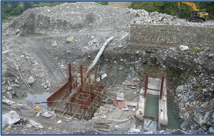
विद्युत गृह क्षेत्रमा भएको निर्माण कार्यको प्रगति ।

दोर्दी-१ जलविद्युत आयोजनाको विद्युत राष्ट्रिय प्रसारण ग्रीडमा जोड्न आवश्यक नेपाल विद्युत प्राधिकरण अन्तर्गतको किर्तिपुर सबस्टेसनको निर्माण कार्य पनि तीव्र गतिमा अघि बढिरहेको छ । सबस्टेसनमा आवश्यक Bay हरुको Foundation कार्य सम्पन्न भई हाल सबस्टेसनको Equipment जडान गर्ने कार्य भईरहेको छ ।