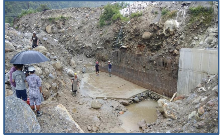
Desender को Spilway को निर्माण एवम् Survey कार्य गरिदै ।