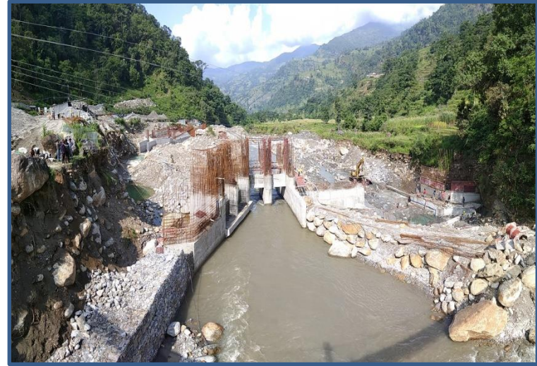
Headwork Area मा हुँदै गरेको हालसम्म निर्माण कार्य।

हेडवर्क्सको सिभिल संरचना अन्तर्गत Desander निर्माण कार्यको प्रगति ६४.० प्रतिशत पुगेको छ।