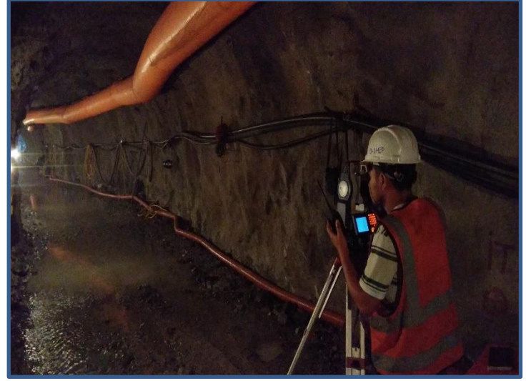
सुरुङ्गको Survey कार्य गरिदै ।

यस आयोजनाको Electromechanical कार्यका लागि B Fouress Pvt. Ltd. (BFL) सँग सम्झौता भइसकेको छ । विद्युतगृहको आवश्यक Design कार्य सम्पन्न भईसकेको छ र हाल Power house मा Excavation को काम सम्पन्न भइसकेको छ । हाल विद्युतगृह निर्माण स्थलमा Earth Mat विछ्याउने कार्य सम्पन्न भईसकेको छ र विद्युतगृहको निर्माण कार्य तिव्र गतिमा अघि बढिरहेको छ । विद्युतगृहको दुवै Unit को Tailrace Gate Frame को जडान कार्य पनि सकी विद्युतगृहको Raft Foundation को निर्माण कार्य पनि निरन्तर भईरहेको छ ।