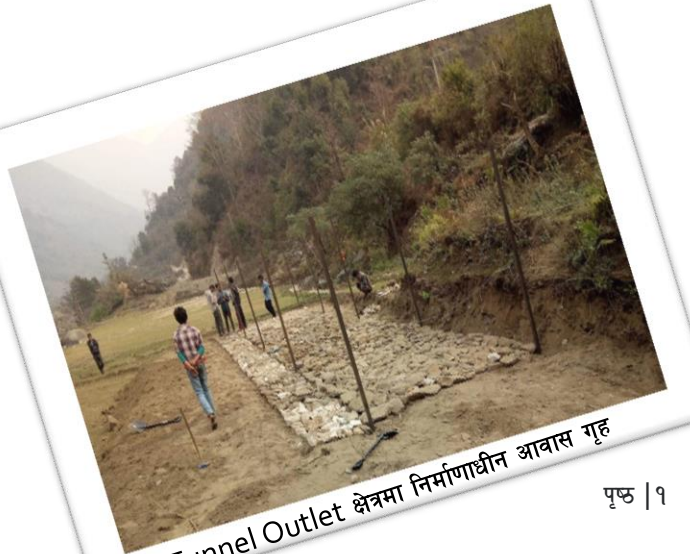
Tunnel Outlet क्षेत्रमा निर्माणधीन आवास गृह