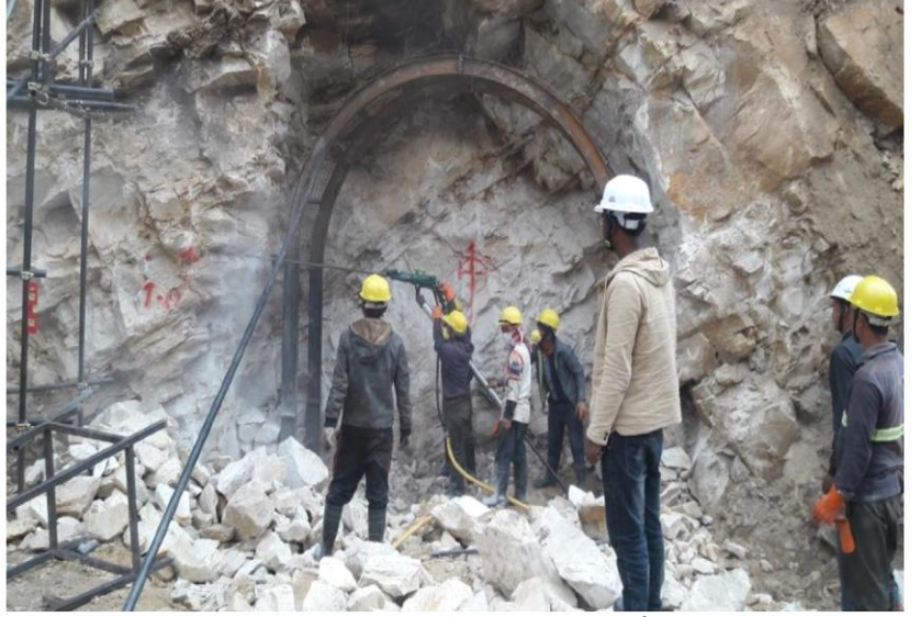
Tunnel Inlet क्षेत्रमा भइरहेको कार्य

दोर्दी -१ जलविद्युत आयोजनाबाट उत्पादित विद्युत राष्ट्रिय प्रसारण लाइन जोड्नका लागि दोर्दी कोरिडोर प्रसारण लाइन र किर्तिपुरमा नेपाल विद्युत प्राधिकरण द्वारा बनाउनुपर्ने सवस्टेसनको ठेक्का प्रक्रिया सकेर विस्तृत सर्भेको कार्य समेत भइरहेको छ ।