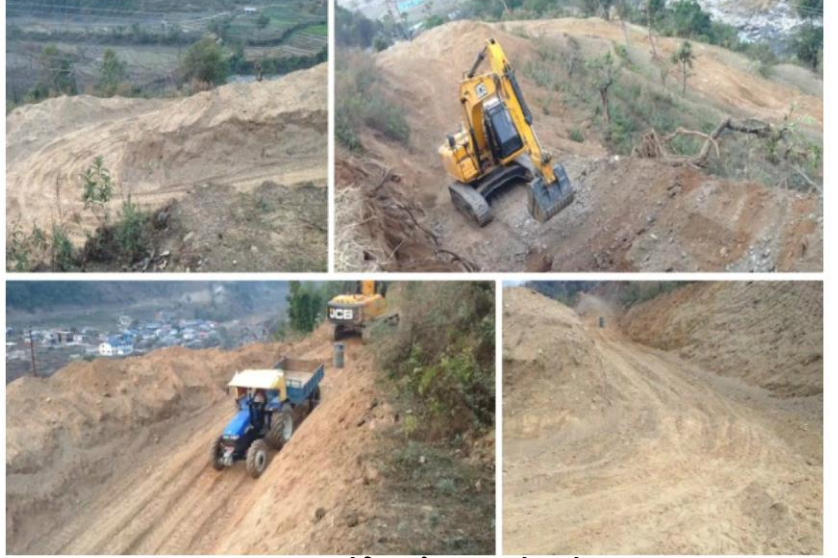
मुख्य सडक देखि सर्ज ट्याङ्क पुग्ने बाटो

यसरी बन्ने प्रसारण लाइन, आयोजनाका भावी संरचनासँग बाधिन नआउन र भविष्यमा यस आयोजनाको प्रसारण लाइन बनाउँदा समस्या नपरोस् भन्ने हेतुले उक्त दोर्दी कोरिडोर प्रसारण लाइनसँग निरन्तर समन्वय गर्ने कार्य जारी छ । यस आयोजनाले स्थानिय प्रशासन र स्थानिय बासिन्दाहरूबाट आयोजना निर्माण प्रक्रियामा निरन्तर साथ र सहयोग प्राप्त गरिरहेको छ ।