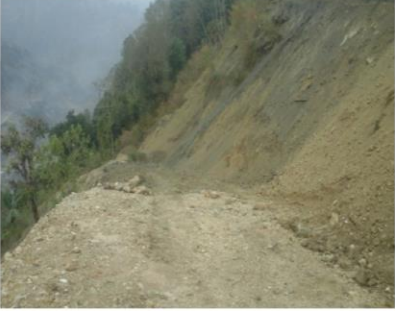
Tunnel Outlet सम्मको पहुँच मार्ग

यसरी बन्ने प्रसारण लाइन, आयोजनाका भावी संरचनासँग बाधिन नआउन र भविष्यमा यस आयोजनाको प्रसारण लाइन बनाउँदा समस्या नपरोस् भन्ने हेतुले उक्त दोर्दी कोरिडोर प्रसारण लाइनसँग निरन्तर समन्वय गर्ने कार्य जारी छ । यस आयोजनाले स्थानिय प्रशासन र स्थानिय बासिन्दाहरूबाट आयोजना निर्माण प्रक्रियामा निरन्तर साथ र सहयोग प्राप्त गरिरहेको छ ।