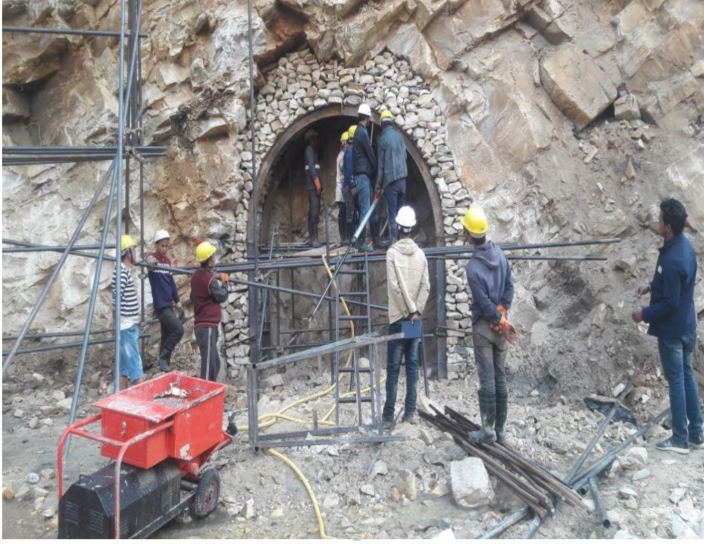
Tunnel Inlet क्षेत्र