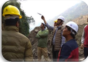
Tunnel Works निरिक्षण

आयोजनाको सुरुङ्ग निर्माण कम्पनी माउन्टेन इन्फ्रा कम्पनी प्राइभेट लिमिटेडले आयोजना स्थलको Head works क्षेत्रमा कर्मचारी आवास, स्टोर निर्माण गरिएको छ भने चाहिने विद्युतीय उर्जाको लागि आवश्यक संरचनाको निर्माण कार्य अन्तिम चरणमा पुऱ्याएको छ भने Tunnel Outlet क्षेत्रमा पनि कर्मचारी आवासको निर्माण कार्य सुरु गरेको छ । यस्तै, सुरुङ्ग निर्माणका लागि आवश्यक विद्युतीय उर्जाको स्वीकृति लिई ट्रान्सफर्मर साइटमा लागि जडान समेत गरिएको छ ।